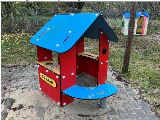
Redskab: Legehus Årgang: 2021 Producent: Kompan Er redskabet mærket: Ja Er der registreret fejl/mangler: Ja