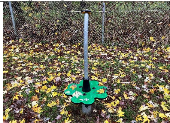
Redskab: Junior spica Årgang: 2021 Producent: Kompan Er redskabet mærket: Ja Er der registreret fejl/mangler: Nej