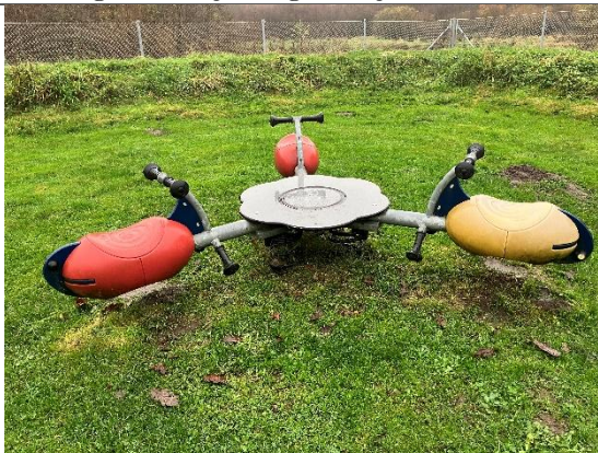
Redskab: Vippedyr Årgang: 2009 Producent: Kompan Er redskabet mærket: Ja Er der registreret fejl/mangler: Nej