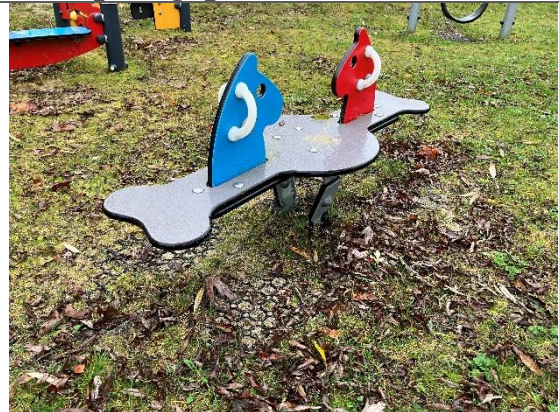
Redskab: Vippedyr Årgang: 2021 Producent: Kompan Er redskabet mærket: Ja Er der registreret fejl/mangler: Nej