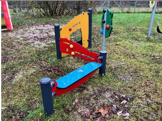
Redskab: Aktivitets redskab Årgang: 2021 Producent: Kompan Er redskabet mærket: Ja Er der registreret fejl/mangler: Ja