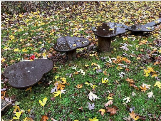
Redskab: Balance blomster Årgang: 2021 Producent: Kompan Er redskabet mærket: Ja Er der registreret fejl/mangler: Nej