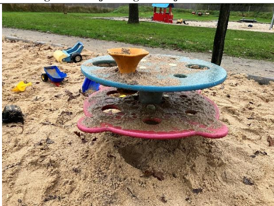
Redskab: Sandbord Årgang: 2009 Producent: Kompan Er redskabet mærket: Ja Er der registreret fejl/mangler: Nej