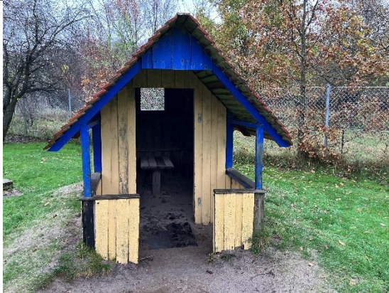
Redskab: Legehus Årgang: 2000 Producent: Trælasten Er redskabet mærket: Ja Er der registreret fejl/mangler: Ja