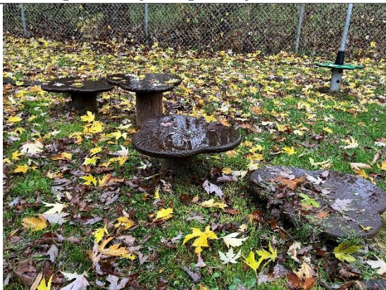
Redskab: Balance blomster Årgang: 2021 Producent: Kompan Er redskabet mærket: Ja Er der registreret fejl/mangler: Nej