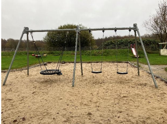
Redskab: Gyngestativ Årgang: 2021 Producent: Kompan Er redskabet mærket: Ja Er der registreret fejl/mangler: Nej