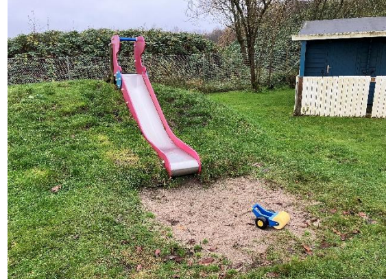
Redskab: Rutsjebane Årgang: 2009 Producent: Kompan Er redskabet mærket: Ja Er der registreret fejl/mangler: Ja