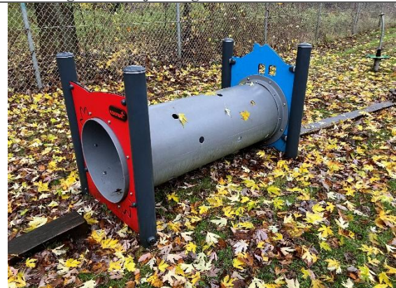
Redskab: Tunnel Årgang: Producent: Kompan Er redskabet mærket: Nej Er der registreret fejl/mangler: Ja