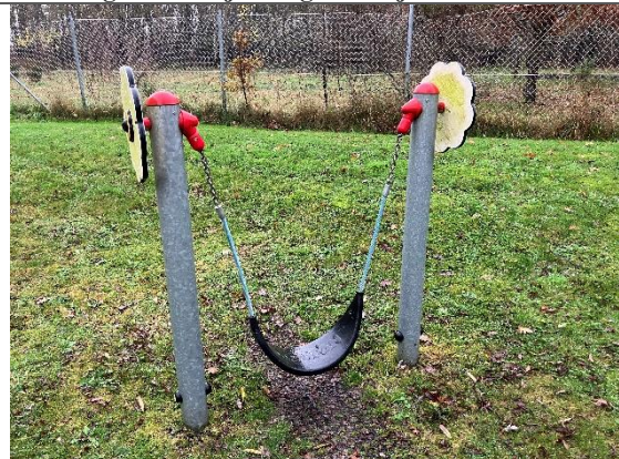
Redskab: Mavegynge Årgang: 2021 Producent: Kompan Er redskabet mærket: Ja Er der registreret fejl/mangler: Ja