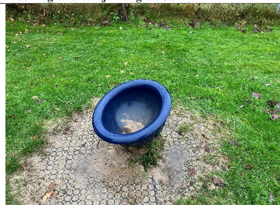
Redskab: Drejekar Årgang: Producent: Kompan Er redskabet mærket: Nej Er der registreret fejl/mangler: Ja