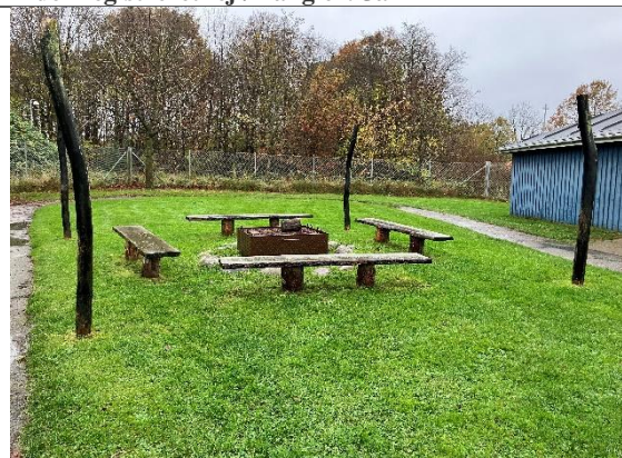
Redskab: Bålsted Ikke omfattet af DS/EN 1176