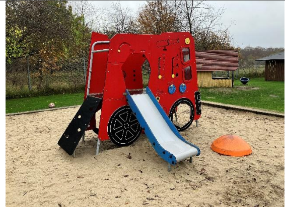
Redskab: Klatretårn Årgang: 2020 Producent: vinci play Er redskabet mærket: Ja Er der registreret fejl/mangler: Ja