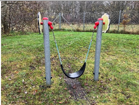
Redskab: Mavegynge Årgang: 2021 Producent: Kompan Er redskabet mærket: Ja Er der registreret fejl/mangler: Ja