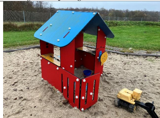
Redskab: Legehus Årgang: Producent: Kompan Er redskabet mærket: Nej Er der registreret fejl/mangler: Ja